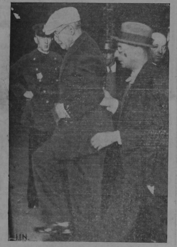
El general Horacio Vázquez, presidente de la República Dominicana, a su llegada a Baltimore para ser operado. El viaje de su patria a dicha ciudad lo hizo en aeroplano.