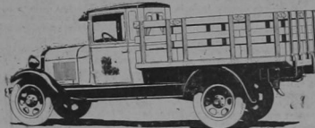
Modelo "A" Media Ton. Modelo "AA" Una y Media Ton.